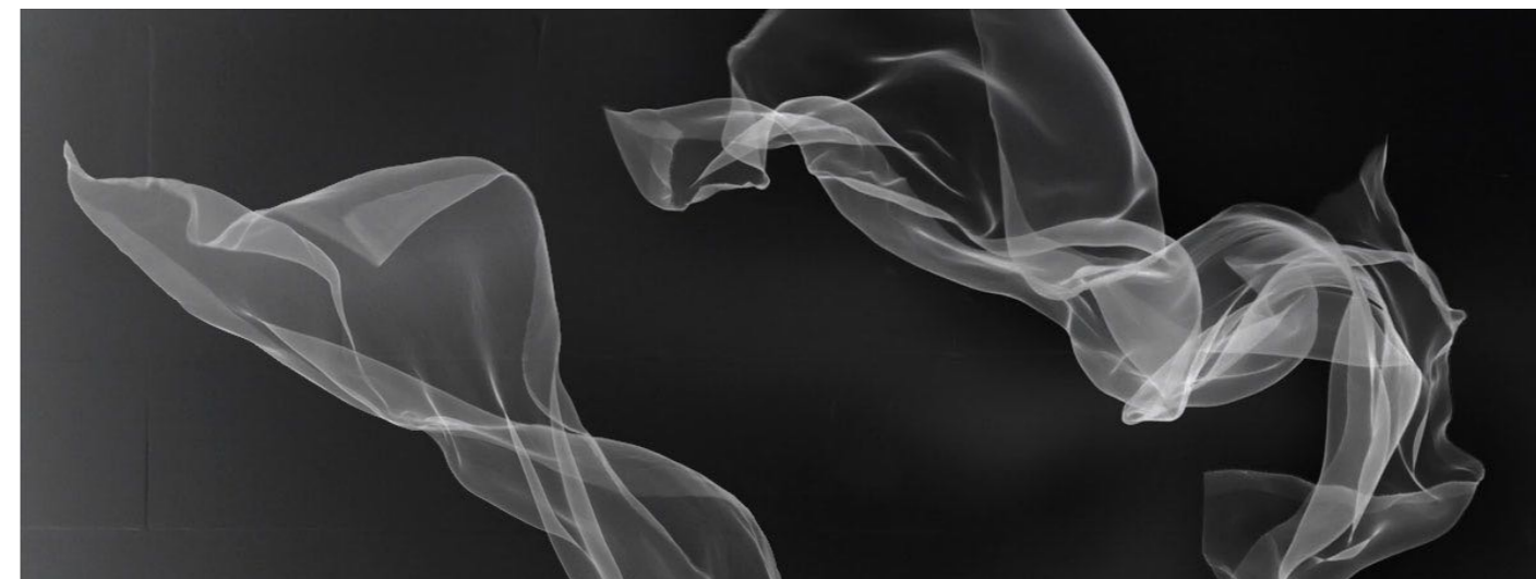
© Yoko Seyama | recherche scénographie

Ainsi, la scénographie de L'Oiseau de feu ne se contente pas d'illustrer le conte. Elle devient un langage à part entière : un espace vivant, instable et sensible, où se matérialisent les mécanismes d'emprise, mais aussi les forces de résistance, de lucidité et de libération.