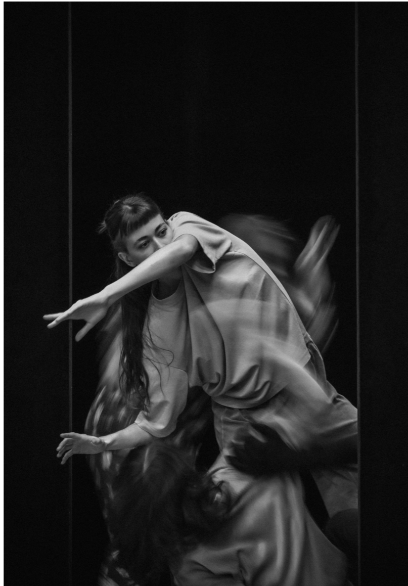
photo shooting L'oiseau de feu

TITRE DE LA SOIRÉE AVANT LA NUIT / L'OISEAU DE FEU