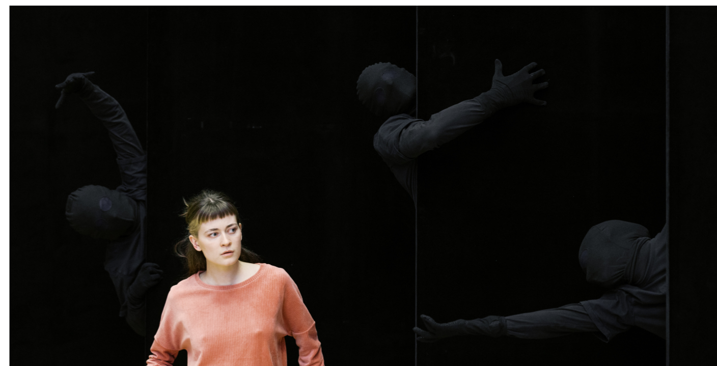
photo shooting L'oiseau de feu