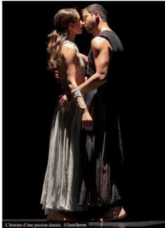
L'histoire d'une passion dansée. © David Bonnet