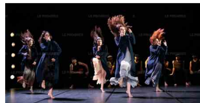
Carmen , interprété par les 13 danseurs du ballet de l'Opéra de Tunis.

Du 18 au 21 février, à la Maison de la danse , Lyon 8 e . Tarifs de 10 à 40 € ; maisondeladanse.com