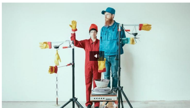
Chamar bell clochette, théâtre percutant / Vertigo / 6 min. / Lundi à 17:09

Interview à Vertigo, RTS la Première, octobre 2025