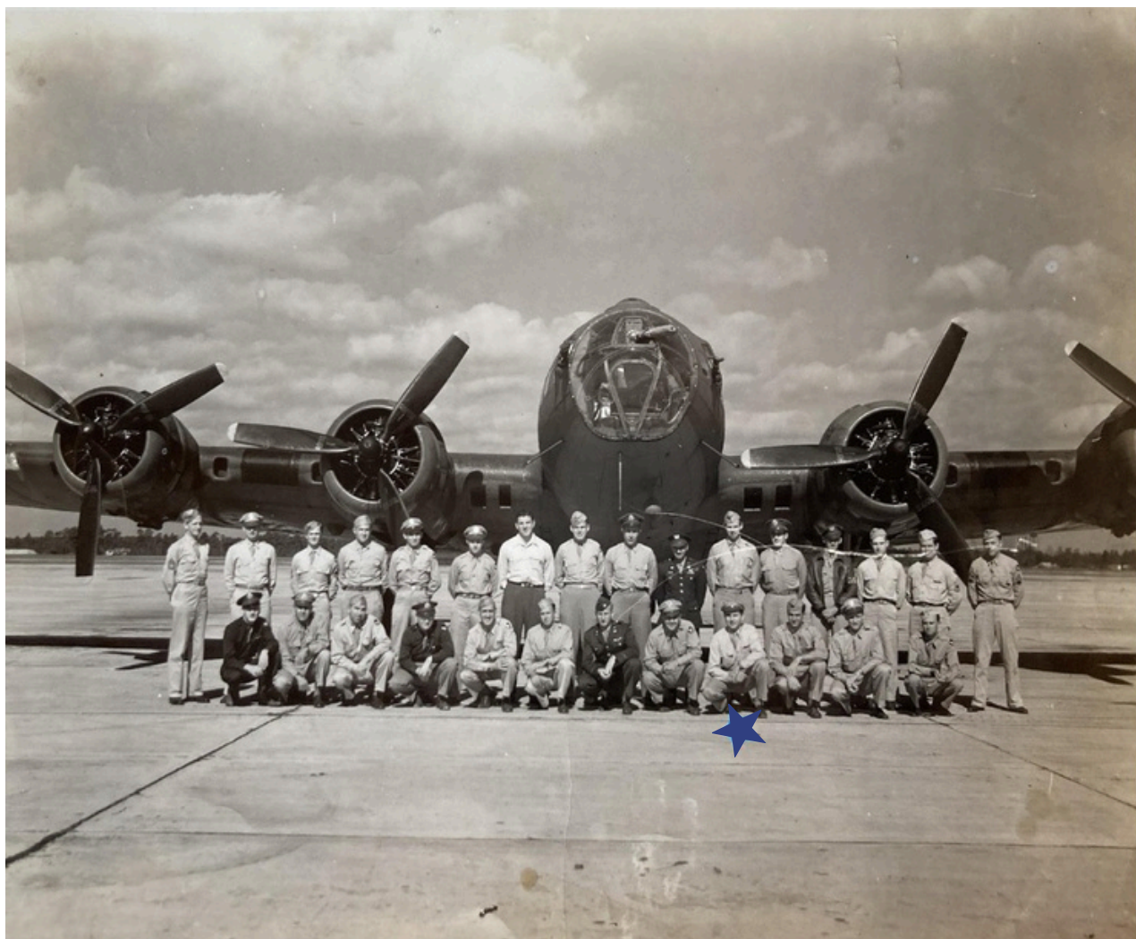
★ Raymond Yahr devant un B-17, 1944