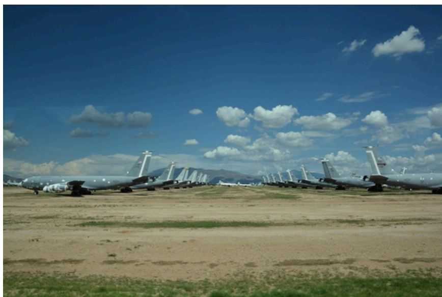
"The Boneyard", le plus grand cimetière d'avions militaires au monde, Tucson, Arizona

Pour finir dans un minimalisme à ras du sol, en rase-motte, de signalétiques d'aéroports, de clignotements brutaux, de flèches autoritaires, d'illusions de labyrinthe, de machines en mouvements ! A voir, à travailler, comme un mille-feuilles, couche après couche.