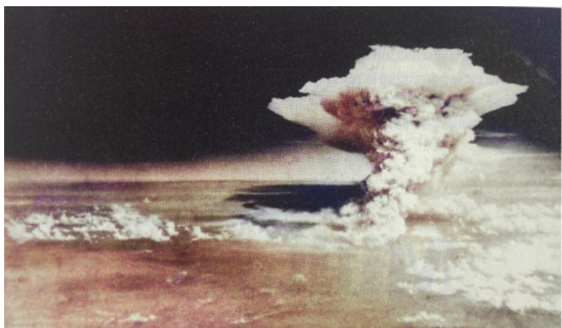
Attaque nucléaire de Hiroshima, août 1945