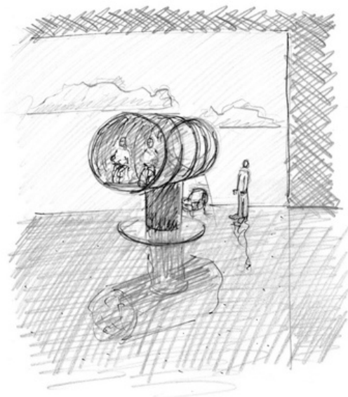
Première esquisse pour la recherche scénographique, Adrien Moretti

Au centre de cet espace : l'ossature d'un cockpit de B17. Il ne s'agit pas d'un simple décor, mais d'un espace scénique vivant qui accueillera l'équipage du spectacle : le comédien, le musicien, le régisseur lumière et vidéo. Le comédien pourra s'en détacher, s'y réfugier, s'y confronter, pour faire vivre la mémoire, la transmission, et les échos du passé dans notre présent.