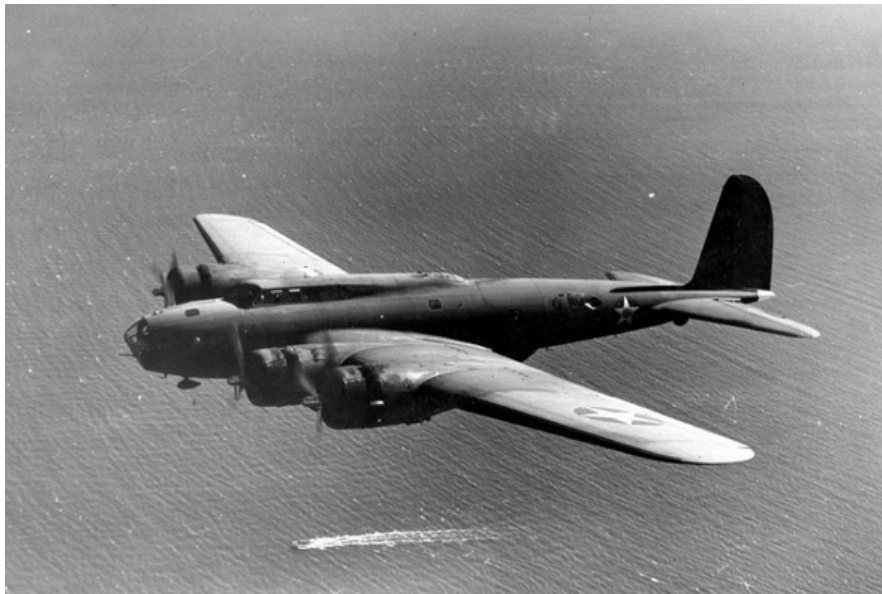
Boeing B-17 Flying Fortress