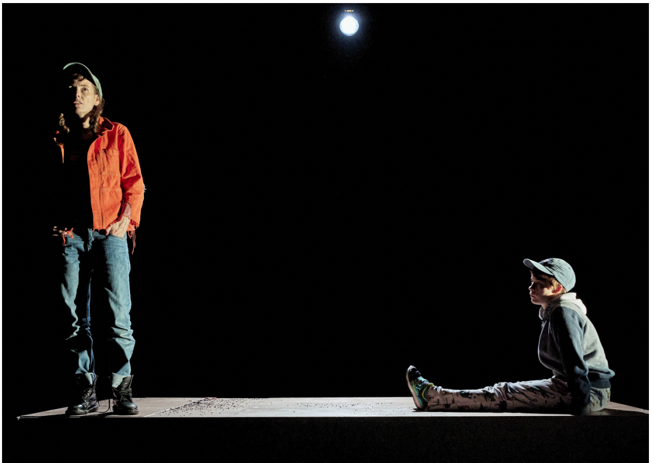
@Christophe Raynaud de Lage