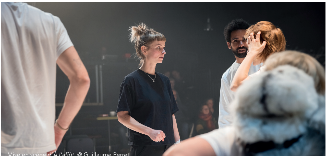
Mise en scène d' À l'affût

Le rapport public/scène ne sera pas le même tout au long de la pièce. Tantôt le quatrième mur est bien présent, tantôt les acteur·rice·s interagissent avec le public. À partir de là, tout est possible. On raconte une histoire, les frontières entre fiction et réalité se brisent, les codes de jeu se transforment et le récit se tord afin de toujours surprendre le·la spectateur·ice.