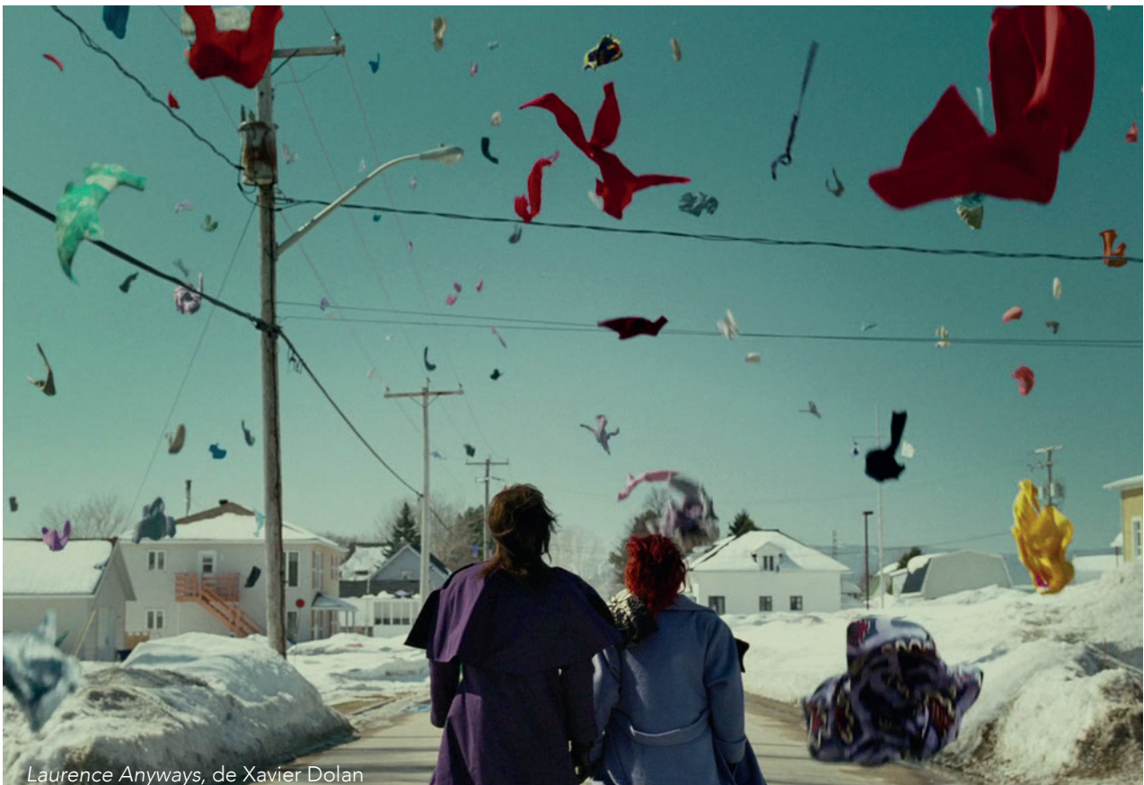
Laurence Anyways, de Xavier Dolan