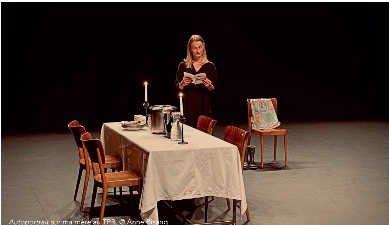
Autoportrait sur ma mère au TPR, © Anne Bisang

Je vois ce spectacle comme une enquête familiale, un laboratoire de recherche, un portrait de "la famille" avec différents points de vue, une tragi-comédie contemporaine aux multiples scénarios, une ode au théâtre, aux films et à la littérature.