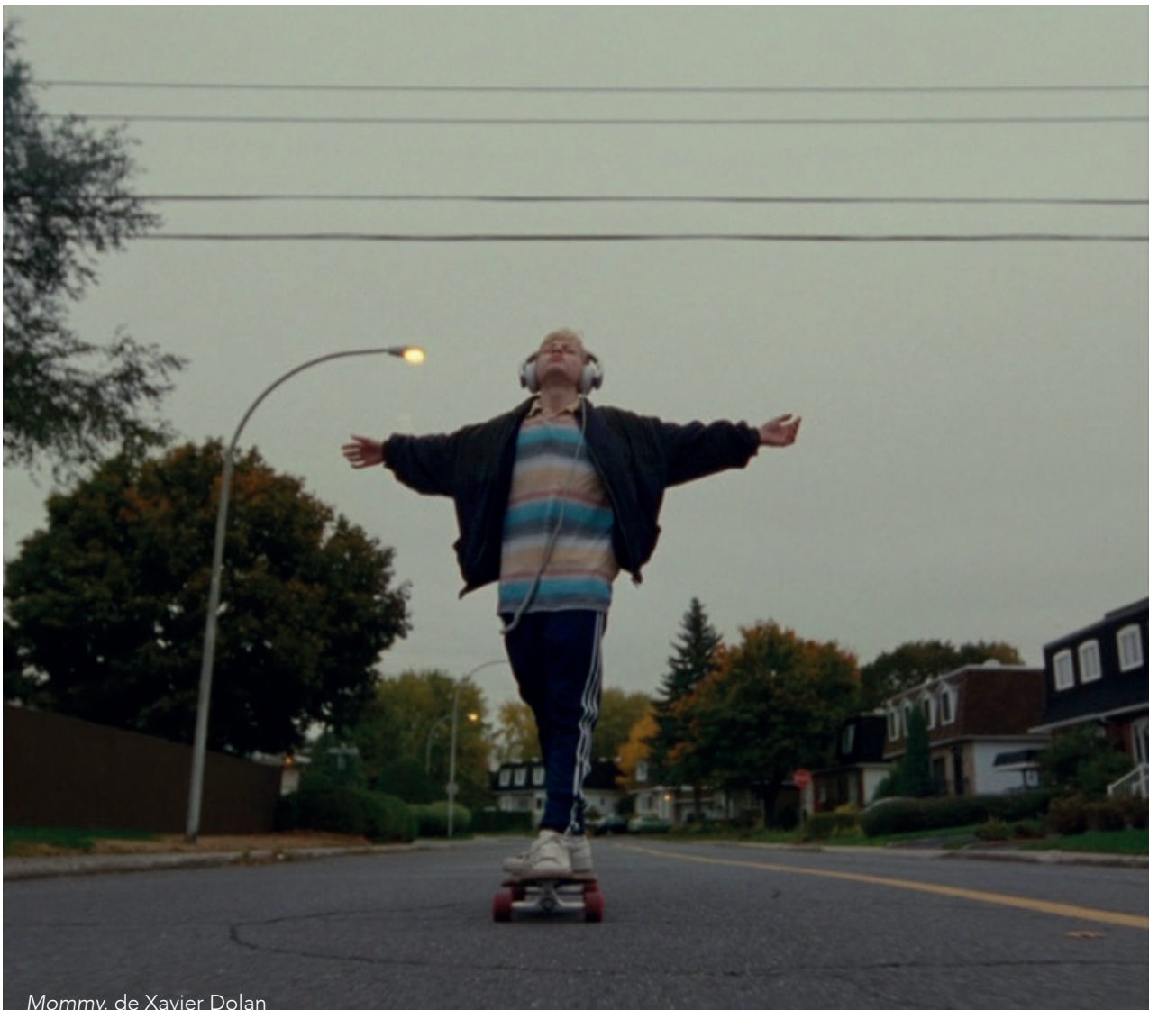
Mommy, de Xavier Dolan

Déluge est un voyage sensible, absurde et drôle, où les corps, les voix et les mémoires, cherchent à réinventer ce que "faire famille" veut dire aujourd'hui.