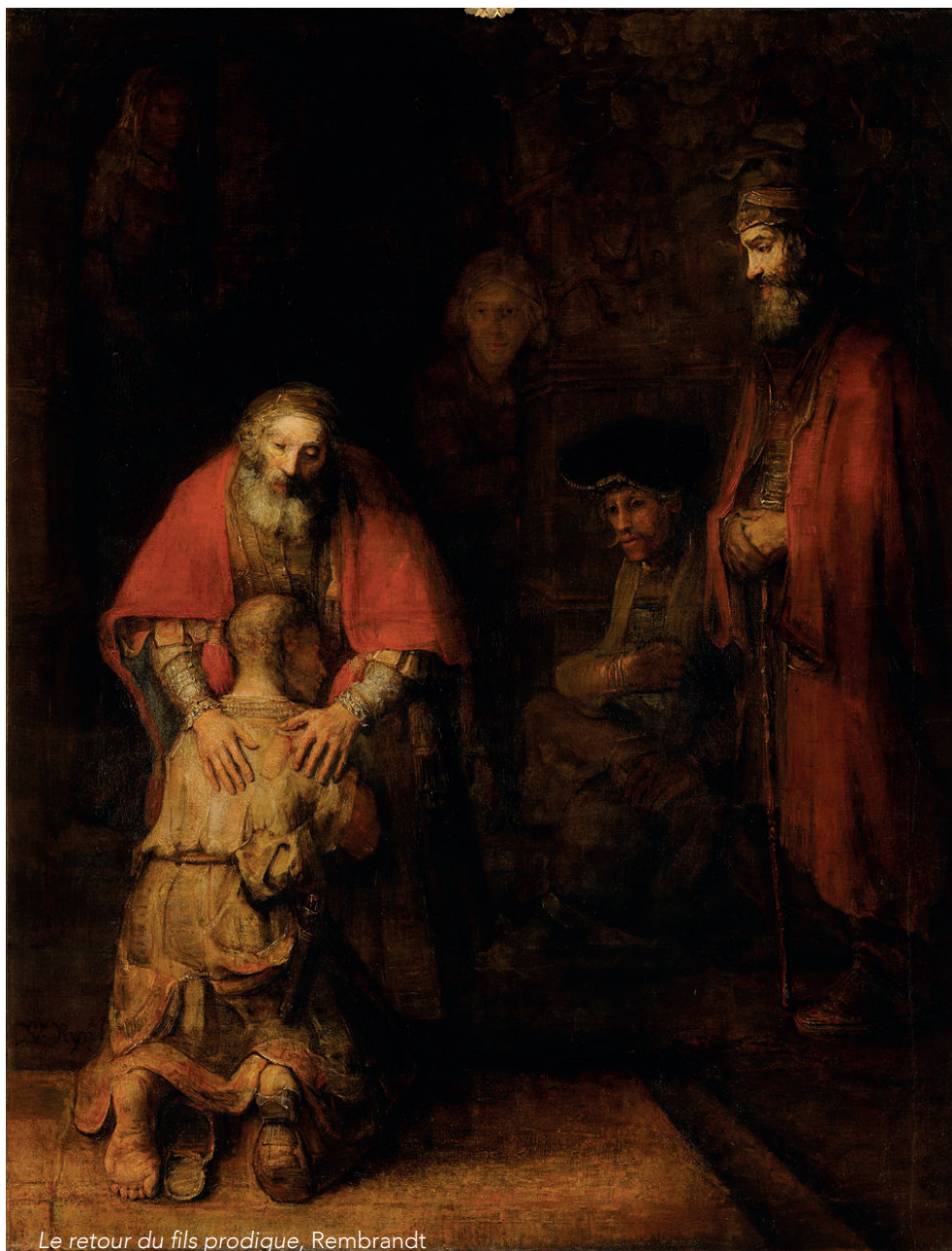
Le retour du fils prodigue, Rembrandt

Dans Juste la fin du monde , Jean-Luc Lagarce aborde un thème auquel je souhaite me confronter depuis longtemps. Il est question du frère qui revient au sein de la famille après plusieurs années d'absence pour leur annoncer sa mort prochaine. Il ne parviendra finalement pas à leur communiquer la nouvelle. La pièce explore les difficultés de communication, les non-dits et les dynamiques familiales.