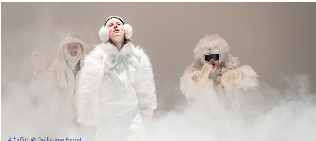
À l'affût