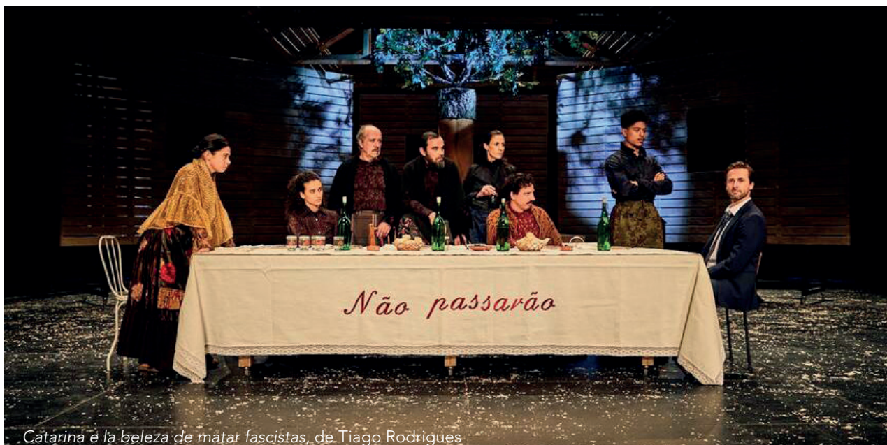
Catarina é a beleza de matar fascistas, de Tiago Rodrigues