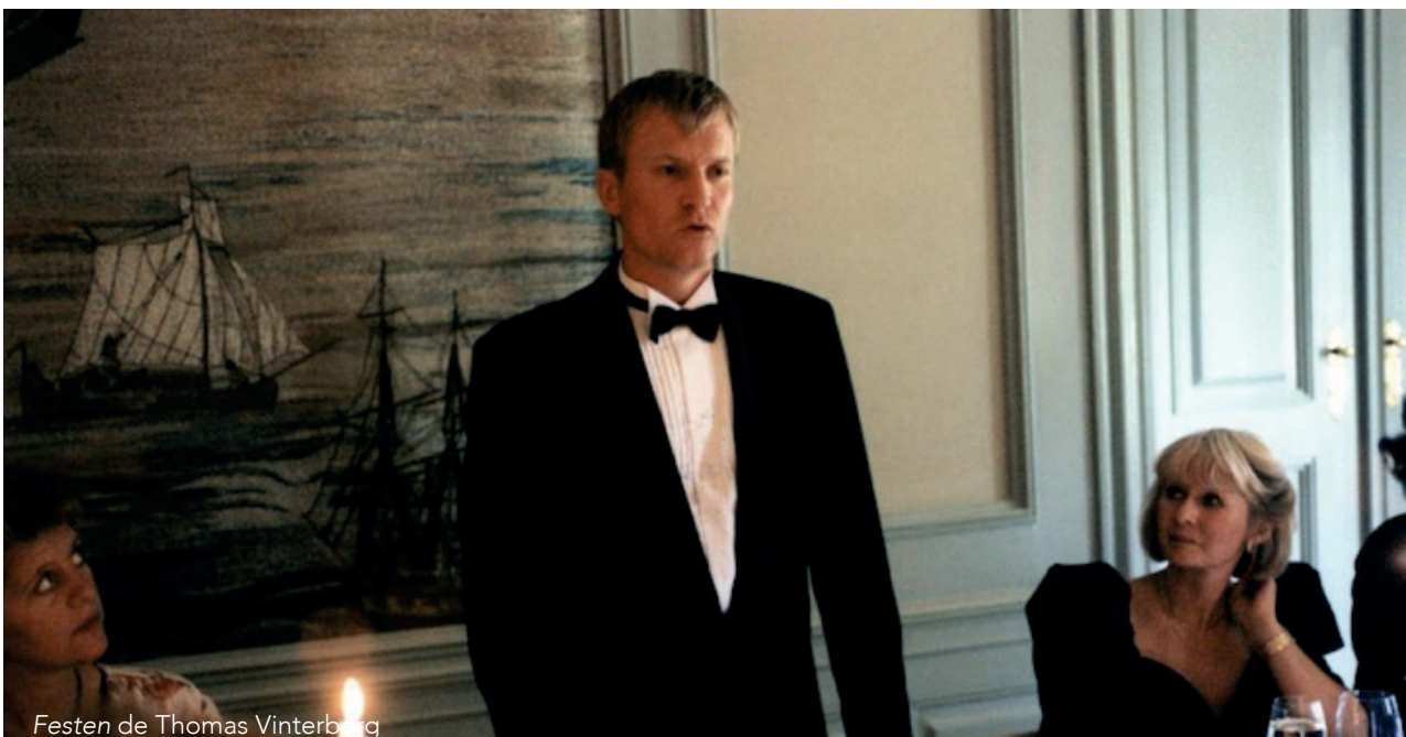
Festen de Thomas Vinterberg