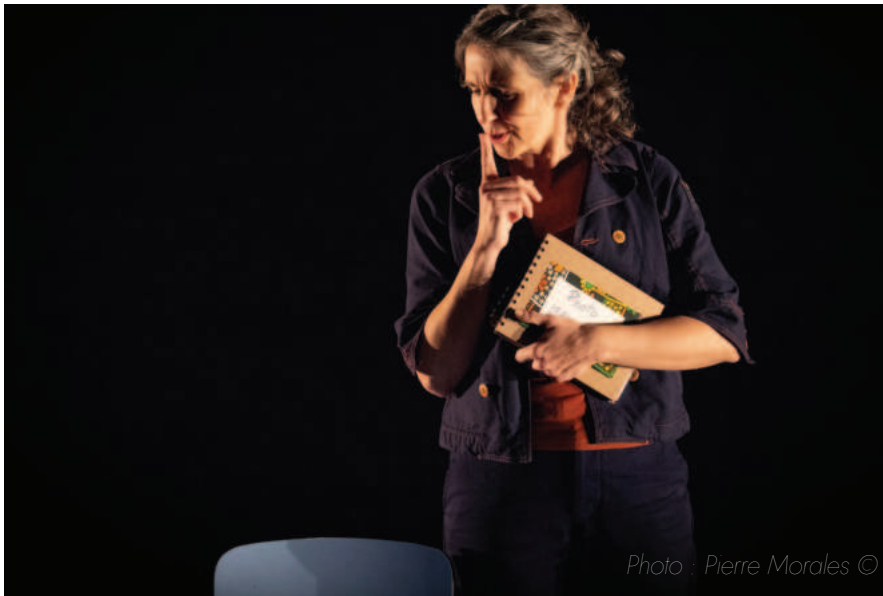
Premières représentations au Théâtre Massalia Decembre 2024

Avec notre silence ce sont le plus souvent nos peurs d'adulte que nous projetons sur lui.