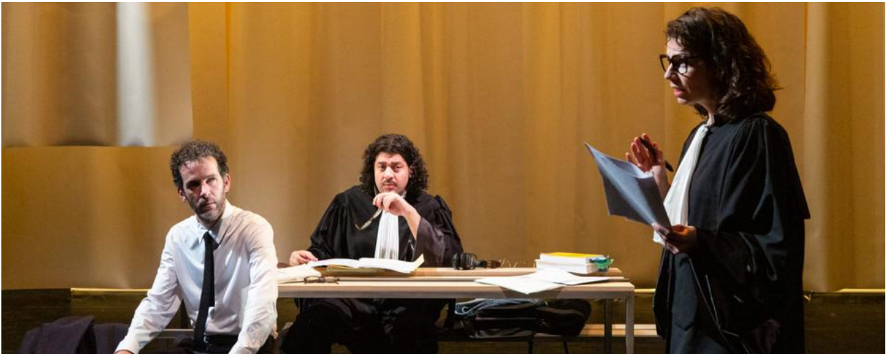
Toute intention de nuire / Vertigo / 6 min. / mardi à 17:08