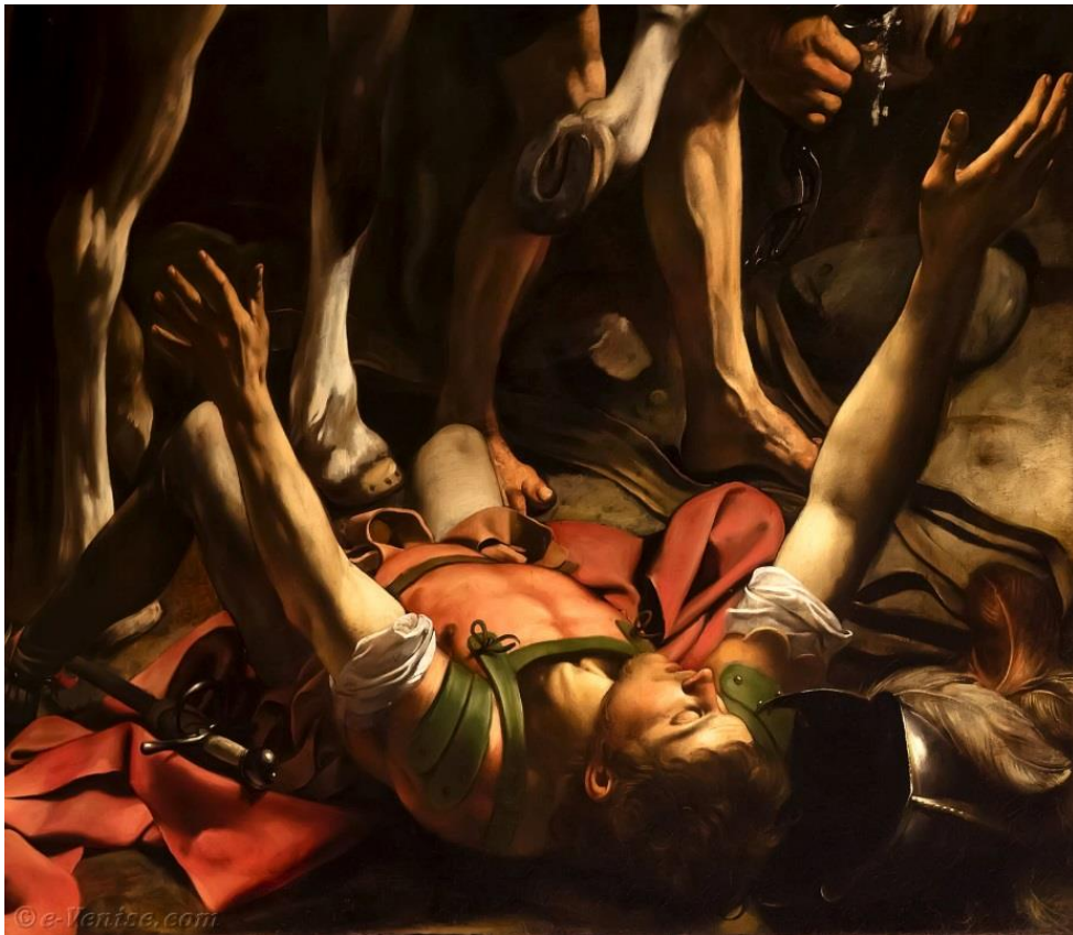
La Conversion de saint Paul (Le Caravage)

« Voilà ce qui m'est arrivé. Et pour ce qui concerne les extraterrestres, excusez-moi, je ne vous ai, probablement, pas bien compris, je pensais que vous vous intéressiez aux moments les plus importants dans la vie d'une personne, c'est pour cela que j'ai accepté de vous rencontrer. Mon mari m'a dit que je devais absolument vous raconter ce cas-là, au Pérou, parce que mon histoire a fait, à l'époque, une très forte impression. Et donc je vous l'ai racontée ». (Joanna, Ovni)