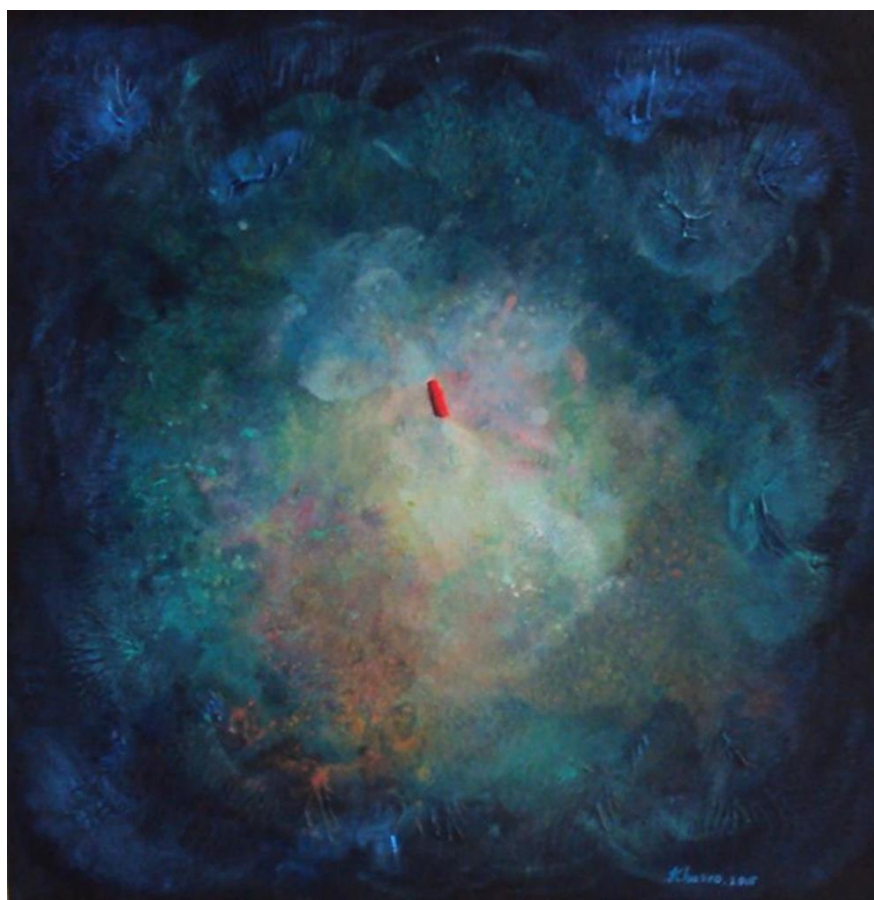
Vue aérienne vert foncée de Derviche par Khusro Subzwari

Viktor, le dixième personnage, prend la parole, crée la surprise et éclaire d'un nouvel angle cette suite de mémoriaux fascinants.